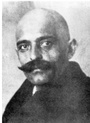
Georges Ivanovich Gurdjieff

El Eneagrama moderno de los tipos de personalidad es una síntesis de distintas tradiciones espirituales y religiosas que condensa la sabiduría y la filosofía perenne acumulada durante miles de años por cristianos, budistas, musulmanes (especialmente los sufíes) y judíos (en la Cábala). Todo ello combinado con todos los conocimientos de la psicología moderna . Para comprender los orígenes del Eneagrama es necesario distinguir entre su símbolo y los 9 tipos de personalidad.